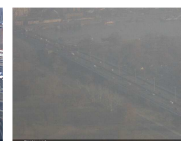
KAMERA: BRANKOV MOST (BEOGRAD)