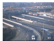
KAMERA: MOSTARSKA PETLJA (SA BIP-A) (BEOGRAD)